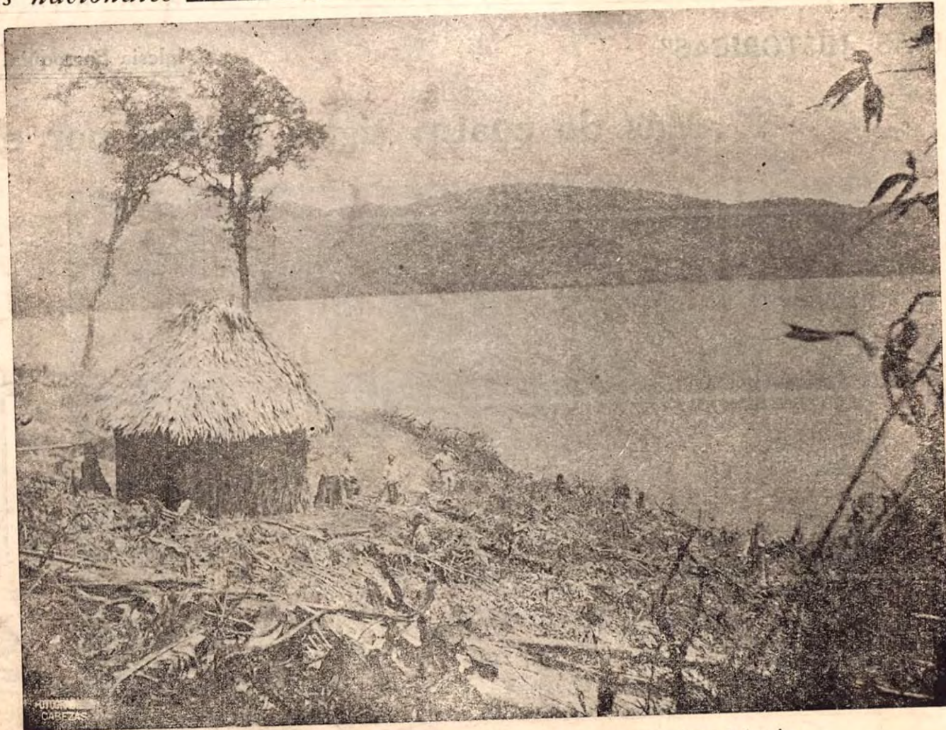
La preciosa laguna de Cotter en Tilarán, zona futura de turismo del país.