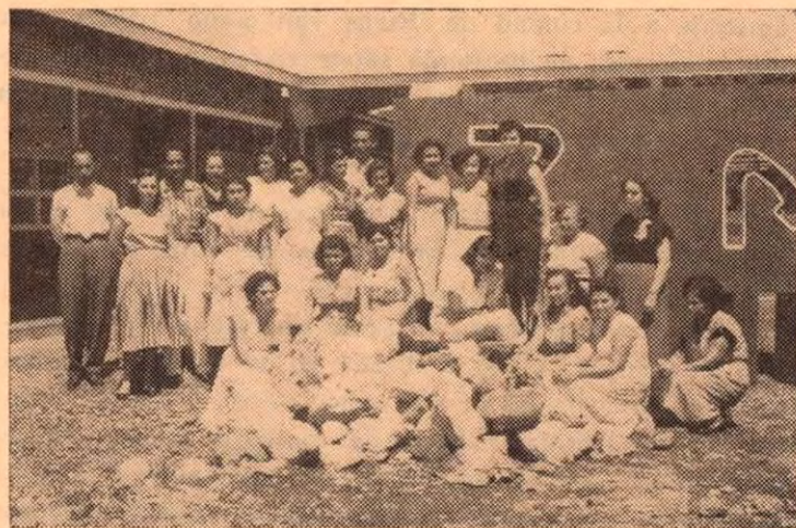
Grupo de maestros de la escuela de Nicoya